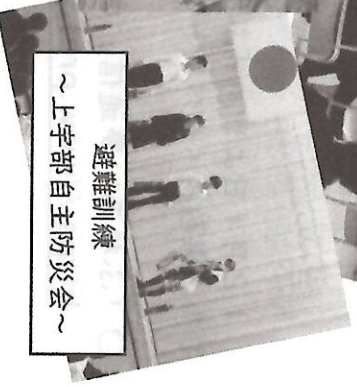
～上宇部自主防災会～